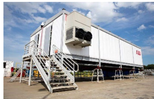
ABB ELETROCENTROS SOROCABA/SP

SISTEMA DE AR CONDICIONADO COM EQUIPAMENTOS DE PRECISÃO