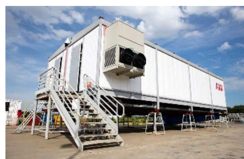
ABB ELETROCENTROS SOROCABA/SP

SISTEMA DE AR CONDICIONADO COM EQUIPAMENTOS DE PRECISÃO